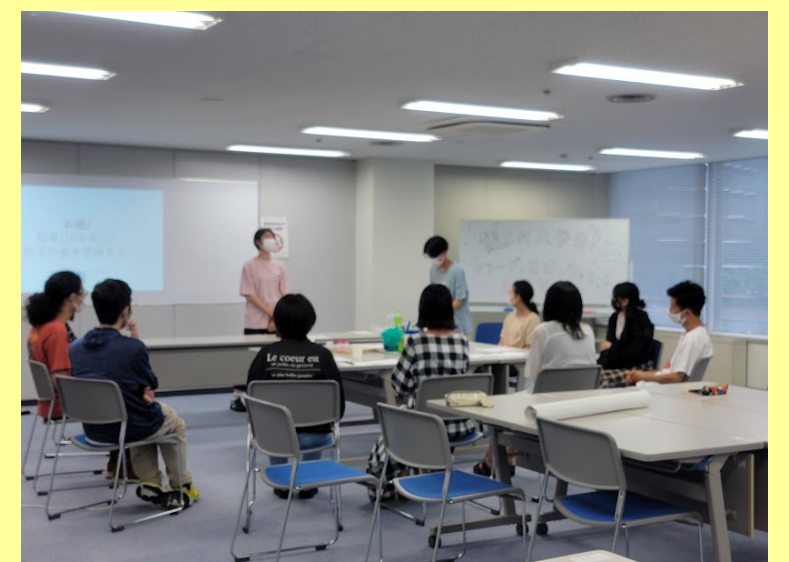
↑前回の集まれ大学生！フリーディスカッションでの写真

大阪公立大学大学院1名、追手門学院大学2名、 大阪工業大学1名、大阪商業大学1名、 四天王寺大学2名、相愛大学2名、阪南大学1名